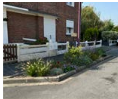
Rue de la Veine Jean et Drève : embellissement floral