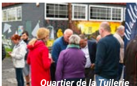
Quartier de la Tuilerie