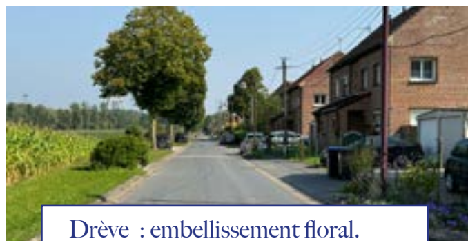
Drève : embellissement floral. Cité du Bosquet : logement rénové

Le démarrage des travaux est prévu en fin d'année 2024, une réunion publique d'informations sera programmée dans les prochaines semaines.