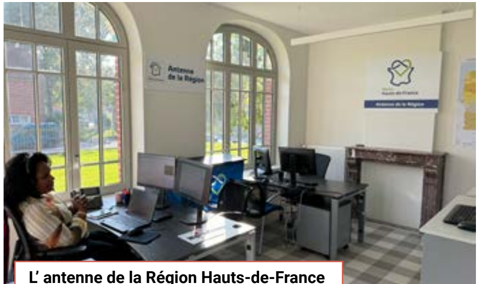
L'antenne de la Région Hauts-de-France